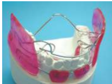
U-Bügel Aktivator nach Prof. Dr. Karwetzky